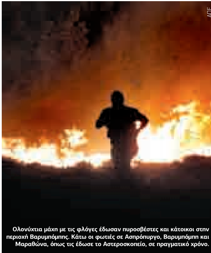
Ολονύκτια μάχη με τις φλόγες έδωσαν πυροσβέστες και κάτοικοι στην περιοχή Βαρυμπόμπη. Κάτω οι φωτιές σε Ασπρόπυργο, Βαρυμπόμπη και Μαραθώνα, όπως τις έδωσε το Αστεροσκοπείο, σε πραγματικό χρόνο.